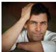
PETER STAMM Suiza