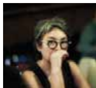
CRISTINA RIVERA GARZA México