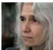
BELÉN GOPEGUI España