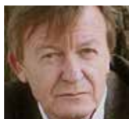
JEAN ECHENOZ Francia