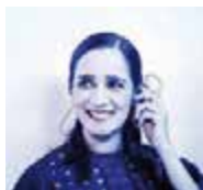
JULIETA VENEGAS México